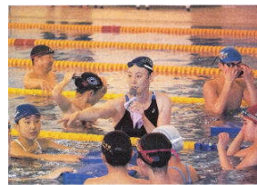
「萩原さんのようにオリンピックに出たい」